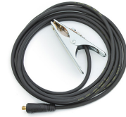
Earth return cable 5 m, 25 mm 2