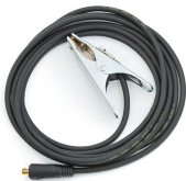
Earth return cable 10 m, 25 mm 2