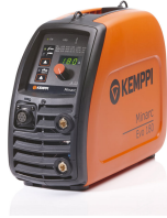
Minarc Evo 180

Un pequeño gigante de soldadura de varilla (MMA), donde quiera lo lleve su trabajo.