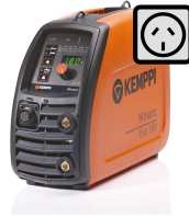
Minarc Evo 180 AU

Un pequeño gigante de soldadura de varilla (MMA), donde quiera lo lleve su trabajo.