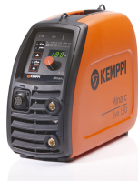
Minarc Evo 180 VRD

Soldadora de varilla (MMA) K5 de Kempfi con un enchufe adecuado para el mercado de Dinamarca. Cuando el tamaño, el peso y la calidad de soldadura son aspectos importantes, la Minarc Evo 180 no tiene rival.