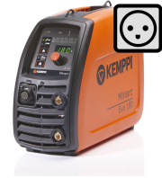
Minarc Evo 180 DK

Soldadora de varilla (MMA) K5 de Kempfi con un enchufe adecuado para los mercados de Australia y Nueva Zelanda. Cuando el tamaño, el peso y la calidad de soldadura son aspectos importantes, la Minarc Evo 180 no tiene rival.