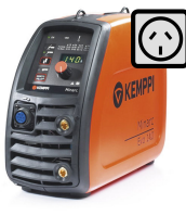
Minarc Evo 140 AU

Soldadora de varilla (MMA) K5 de Kempfi, función de dispositivo de reducción de voltaje. Cuando el tamaño, el peso y la calidad de soldadura son aspectos importantes, la Minarc Evo 180 no tiene rival.